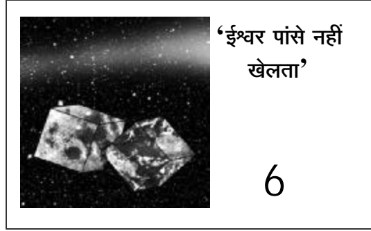
‘ईश्वर पांसे नहीं खेलता’