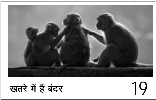
खतरे में हैं बंदर