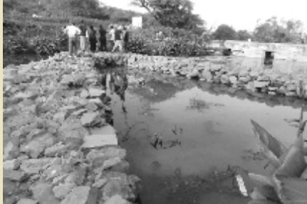
ग्रीन ब्रिज से होगी नर्मदा प्रदूषणमुक्त