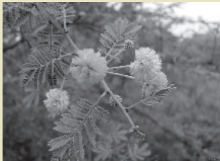
बबूल का वैज्ञानिक नाम बदला