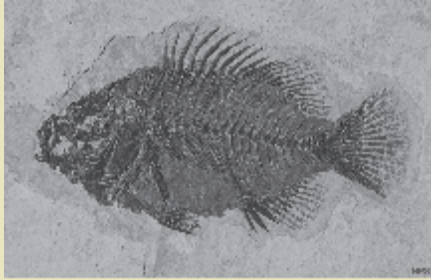
जीवाश्म विज्ञानी अतीत को पुनर्जीवित करते हैं