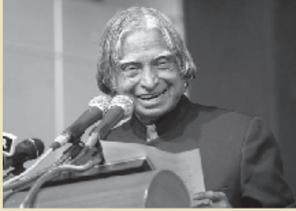
जन-जन के कलाम