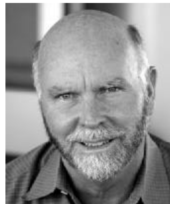
जे. क्रेग वेंटर