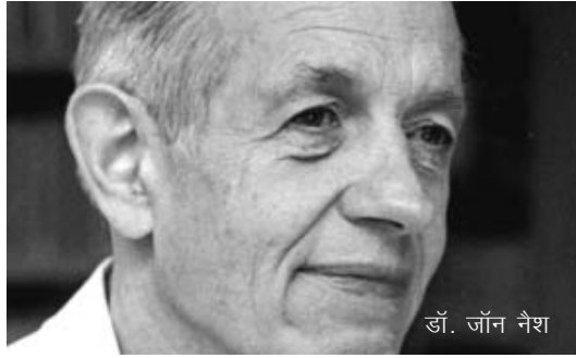
डॉ. जॉन नैश

वर्ष 2015 का गणित का प्रतिष्ठित एबेल पुरस्कार अमेरिका के दो गणितज्ञों जान नैश और लुई नीरेनबर्ग को प्रदान किया गया। यह पुरस्कार नार्वे की सरकार प्रति वर्ष गणितज्ञ नील्स हेनरिक एबेल की स्मृति में प्रदान करती है। एबेल पुरस्कार को गणित का नोबेल पुरस्कार कहा जाता है।