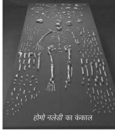
होमो नलेडी का कंकाल

विदा हो चुके वर्ष में पुरातत्त्वविदों ने दक्षिण अफ्रीका में एक गुफा से प्राप्त पन्द्रह कंकालों के आधार पर मनुष्य की एक नई प्रजाति होमो नलेडी खोजने की घोषणा की। जानकारों के अनुसार ये मानव कंकाल दो लाख वर्ष पुराने हो सकते हैं। इसमें प्राचीन और आधुनिक मानव प्रजाति दोनों के मिश्रित लक्षण मिले हैं। वैज्ञानिक शोध में बताया गया है कि होमो नलेडी रीति-रिवाजों के जानकार थे और संकेतों