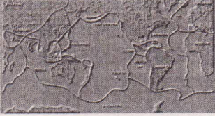
पृष्ठ - 9

राष्ट्रीय विज्ञान एवं प्रौद्योगिकी संचार परिषद्, डी.एस.टी. की एक परियोजना