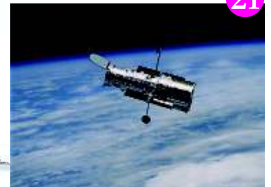
आवरण: अतनु राय