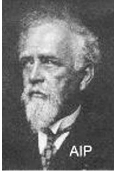
फ्रांसिसी वैज्ञानिक ज़्यां पेरिन