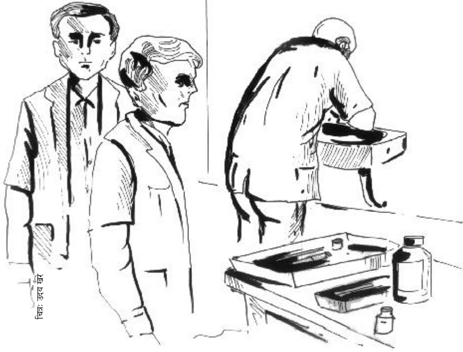
चित्र: उदय खेर

वाक्य सुन न लिया हो। प्रोफेसर बिल्कुल चुपचाप चला आया था। वयदा ने उसके चिरपरिचित, रूखे, झुर्रीदार चेहरे को ताका। वह चिलमची पर झुका हुआ था। वह उदास दिख रहा था। बस और कुछ नहीं तो भी यह भांपकर कि वह कुछ बोलने वाला है वयदा चिहंक गया।