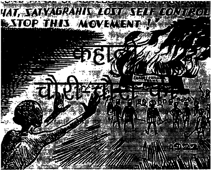
असहयोग आंदोलन पर टिप्पणी करता अमृत बाजार पत्रिका में प्रकाशित एक कार्टून