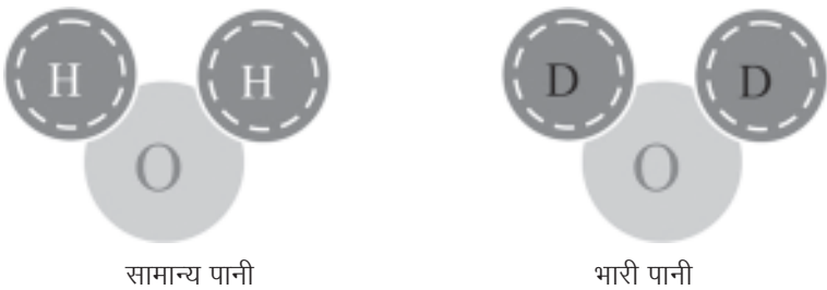
चित्र-3: सामान्य पानी और भारी पानी की रासायनिक संरचना। सामान्य पानी के विपरीत भारी पानी में हाइड्रोजन-1 आइसोटोप की बजाय ड्यूटेरियम की मात्रा अधिक होती है।

पानी के रंग को लेकर एक रोचक बात और सुनिए। आपने भारी पानी (गुरुजल) का नाम तो सुना ही होगा। रासायनिक रूप से तो यह पानी ही